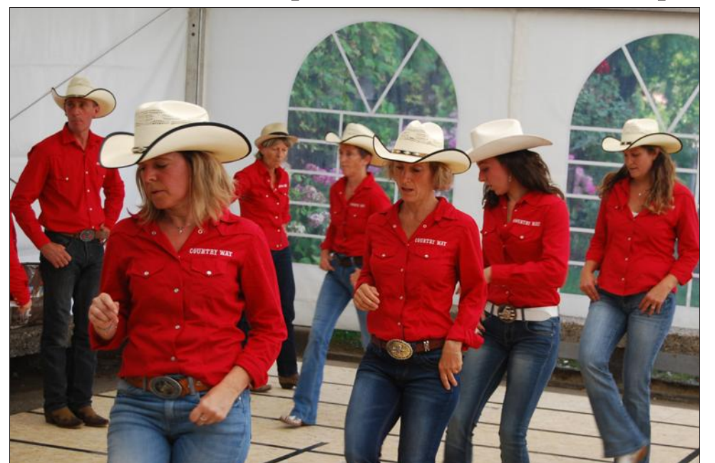
Les danseurs de l'association Country-Way ont proposé des démonstrations.

Pour s'inscrire à Country Way et apprendre à danser la country (de 7 à 77 ans) : countryway-sldp@sfr.fr ou 06 76 06 66 42.